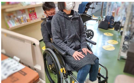
松永製作所の新作車いす